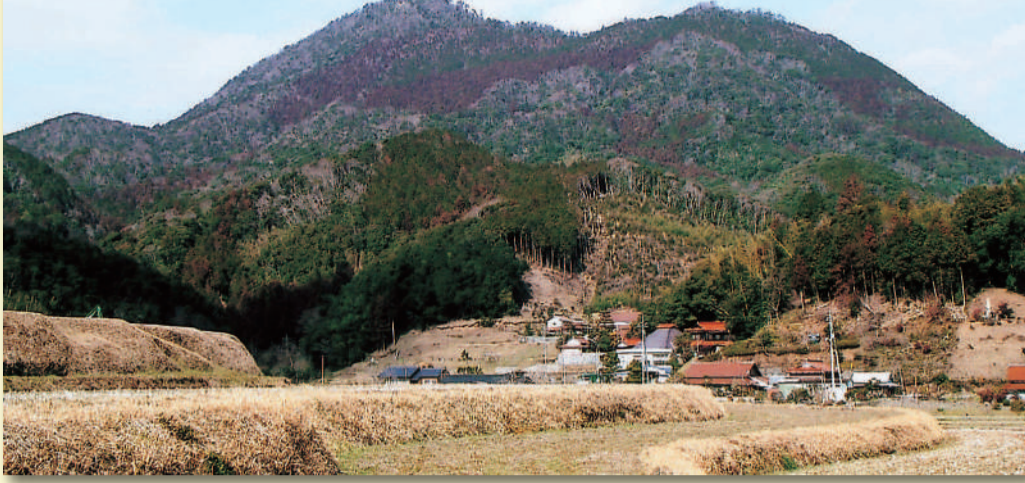
下荒滝方面より望む